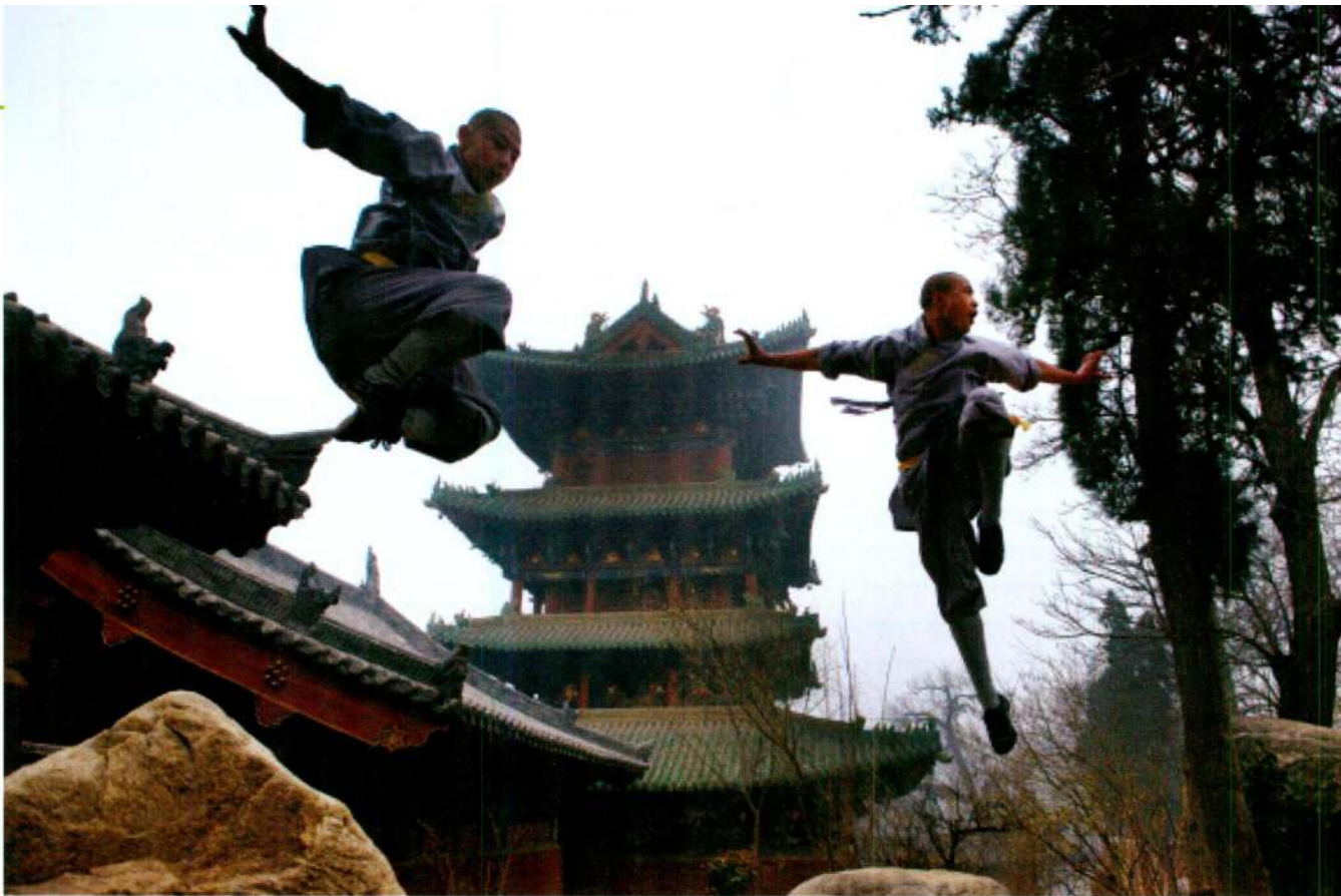
נידרי שאולין ידועים בטכניקות הלחימה המרשימות שלהם, לא מעט בזכות סרטי קונג'פו ואומנויות לחימה הנפוצים במערב. חניכי שאולין מתאמנים בחצר המנזר, 2013 Jeremy Horner/LightRocket/Getty Images